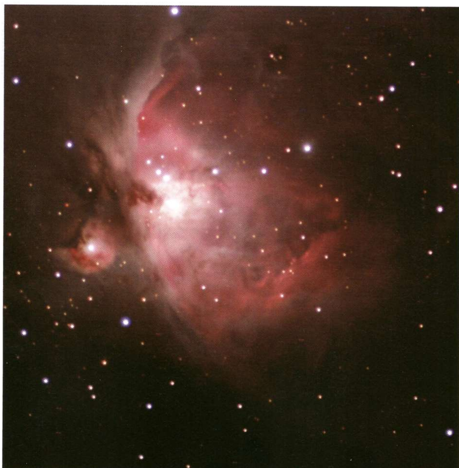
Abb. 4: Der Orionnebel M 42 , aufgenommen mit einem 2,4"-Refraktor bei 355mm Brennweite und Kamera DBK 31AF03.AS.

Es zeigt sich sehr schnell beim nächtlichen Einsatz der Kameras, dass sie in der Bedienung einfach und unkompliziert zu handhaben sind. Bedingt durch ihre technischen Daten eignet sich die kleine Farbkamera DBK21AF04 besonders für die Fotografie der Planeten – hier ist ihr doch recht kleines Gesichtsfeld ausreichend. Bereits bei der Fotografie von Mondetails werden allerdings die durch den kleinen Bildausschnitt auftretenden Beschränkungen