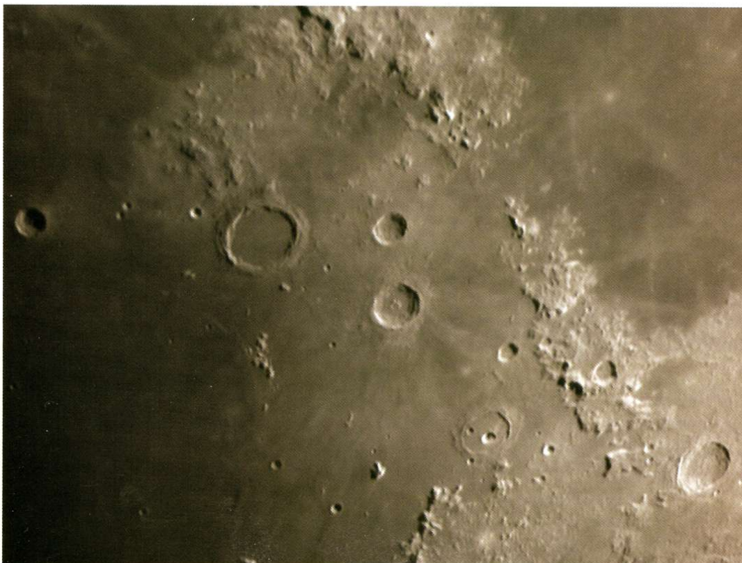
Abb. 2: Das Mare Imbrium mit den Kratern Archimedes, Aristillus und Cassini, aufgenommen mit einem 8"-SCT bei 2000mm Brennweite und Kamera DBK31AF03.

Die DBK41AF02 gehört mit ihrem 1/2"-Chip zu den Flagships der Kameraserie. Der verwendete Sony-Chip ICX205AK bietet eine Auflösung von 1280×960 Pixel, dies entspricht 1,2 Megapixel, bei einer Pixelgröße von 4,65µm×4,65µm. Der 7,60mm×6,20mm große Chip bietet insgesamt eine Bilddiagonale von 8mm. Während schon die Belichtungszeit und die Datentiefe gegenüber den anderen Modellen unverändert sind, liegt auch der Stromverbrauch dieses Modells bei unveränderten 200mA (12V). Bedingt durch die erhöhte