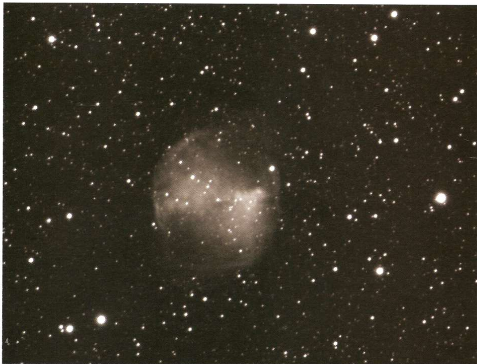
Abb. 3: Der Hantelnebel M27 , aufgenommen mit einem 8"-SCT bei 2000mm Brennweite und Kamera DBK 31AF03.AS.

Bildgröße sinkt die maximale Bildrate gegenüber den Modellen mit kleineren CCD-Chips auf 15 Bilder pro Sekunde.