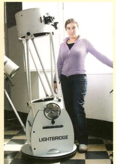
Il dobson Meade LightBridge.

Al contrario, il mercato degli apocromatici di fascia più elevata e di apertura più grande (dai 100 mm in su) fatica a uscire dalla sua piccolissima nicchia, e il mercato langue, forse perché saturato negli anni pas-